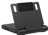
Foldable Stand Hub