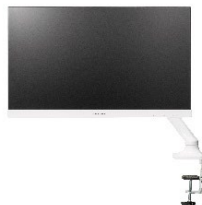
液晶ディスプレイ