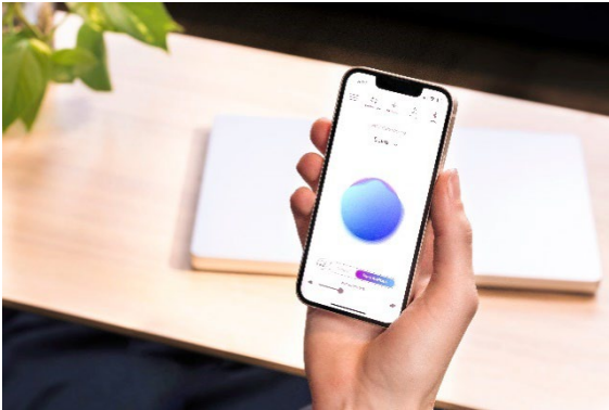
スマホと連携して使うパーソナライズドサウンド機能

4つのマイクをそれぞれのイヤホンに搭載し、周囲の環境から不要な低音を排除して音声を正確に拾います。