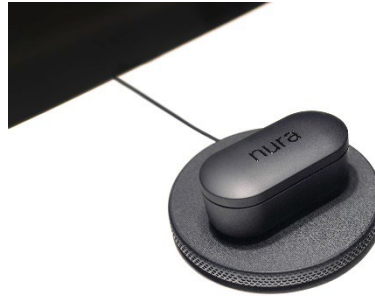
Qi 規格に準拠した充電機器に専用充電ケースを置いて、ワイヤレスで充電が可能